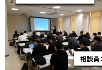
相談員スキルアップ研修