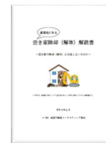
空き家除却解説書 (所有者向け)