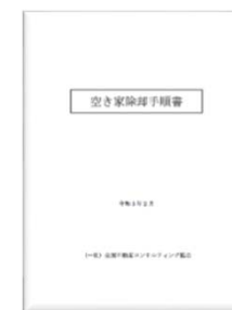
空き家除却手順書 (地方の相談員向け)