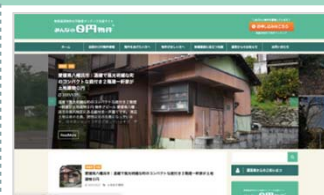
マッチングサイト「みんなの0円物件」掲載