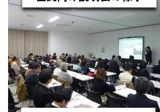
個別相談会の様子